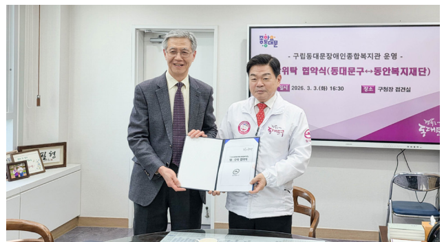
▲3월 3일 진행된 민간위탁 협약식.

이번 협약은 지난 시간 동안 쌓아온 운영 성과와 신뢰를 다시 한 번 확인하는 자리이기도 했습니다. 구립동대문장애인종합복지관은 앞으로도 지역사회와 긴밀히 협력하며 장애인복지 증진을 위해 힘차게 달려 예정입니다.