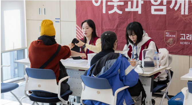
▲기본검진을 받고 있는 참여자들.