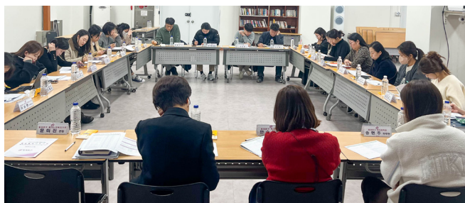
▲동대문구청에서 매일 2회 진행되는 통합지원회의.