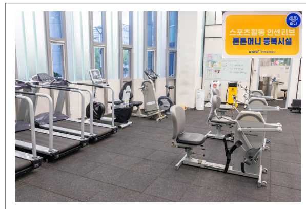
▲복지관 1층에 위치한 장애인운동실 건강해GYM.

특히 우리 복지관은 서울시 장애인복지관 중에서 최초로, 전국에서도 두 번째로 튼튼머니 적립시설로 지정되었습니다. 그동안 튼튼머니는 주로 비장애인 중심 체육시설에서 운영되어 장애인들이 혜택을 체감하기 어려운 구조였는데요. 이번 지정을 계기로 장애인의 스포츠 참여 기회와 접근성이 한층 넓어질 것으로 기대됩니다.