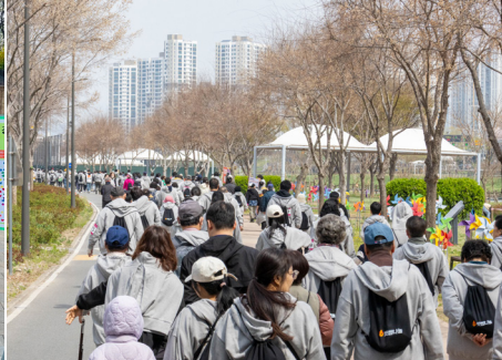
▲제3회 거북이 걷기대회