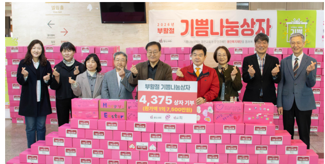
▲4월 7일 진행된 동안교회 기쁨나눔상자 전달식.

넘길 수 있을지 걱정도 있었다고 하는데요. 부활절을 앞두고 4,000 상자 중 절반에 가까운 1,997 상자만 모인 상황이었지만, 짧은 시간 동안 성도들의 마음이 모여 결국 역대 가장 많은 4,375상자가