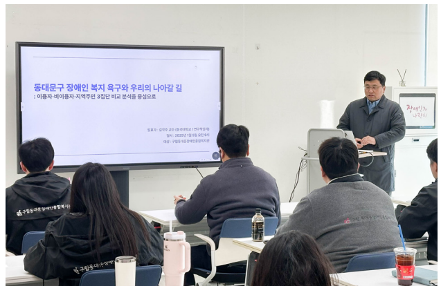
▲1월 5일 진행된 동대문구 장애인 복지 욕구조사 직원교육.

직원들은 조사 결과를 들으며 지금 우리가 서 있는 자리를 짚어보고, 향후 나아갈 방향을 고민해봤는데요.