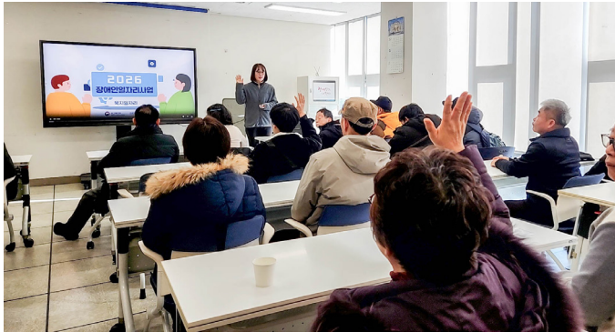
▲필수교육을 듣고 있는 참여자들.