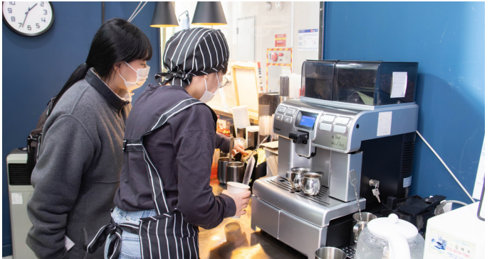
▲카페에서 근무 중인 참여자.

2026년 우리 복지관에 새로운 도전을 시작한 이들이 있습니다. 바로 2026년 장애인복지일자리(참여형) 참여자들인데요.