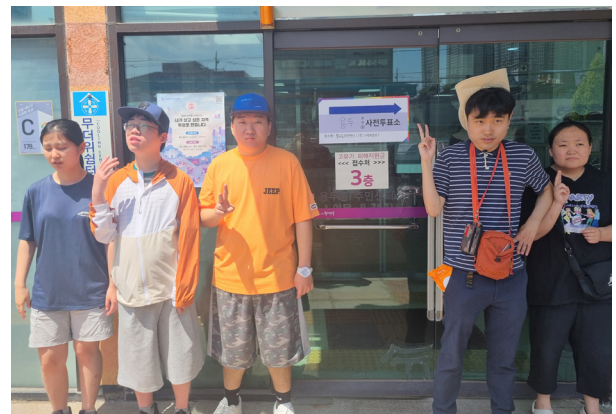
▲사전투표에 참여한 오동통대학 참여자들.

이번 경험이 참여자들이 참정권의 의미를 이해하고, 지역사회 구성원으로서 자신의 권리를 직접 실천해보는 뜻깊은 시간이 되었기를 바랍니다.